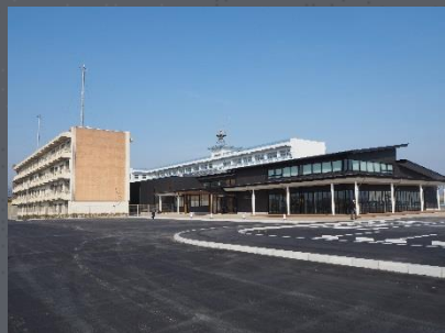
気仙沼市東日本大震災遺構・伝承館