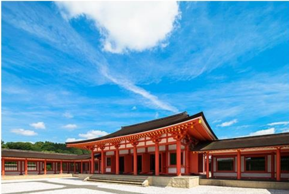
約20ヘクタールの広大な敷地を誇る「歴史公園えさし藤原の郷」