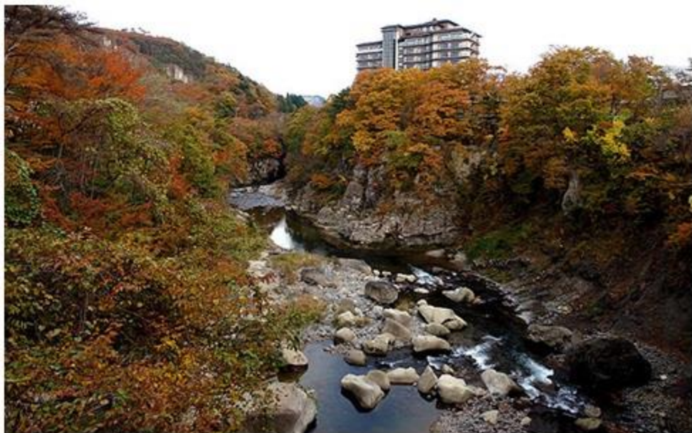
「日本三御湯」のひとつとして全国的に知られた秋保温泉