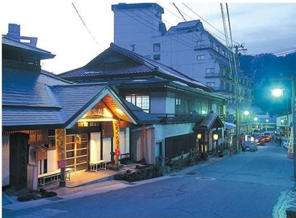
共同浴場「滝の湯」の趣きある建物は温泉街のシンボル