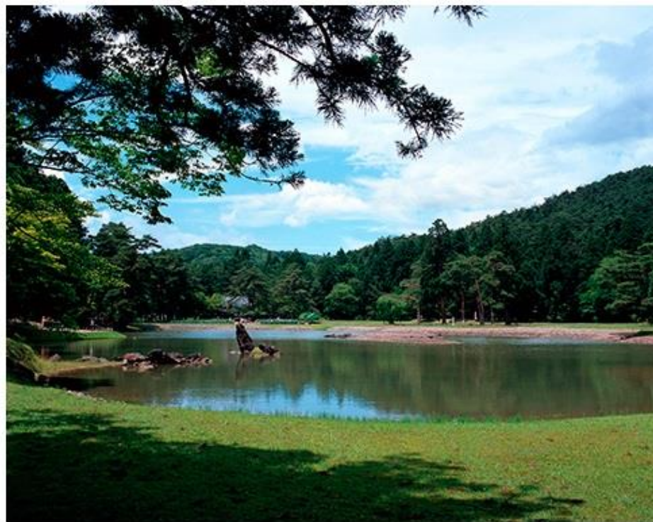
創られた当初の姿を残す毛越寺境内の大泉が池