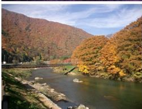
静かで、雰囲気のある温泉地