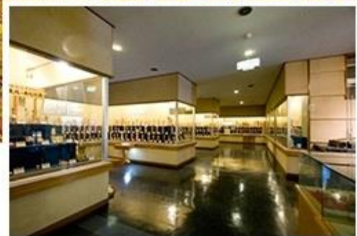
常時数千本のこけしを展示