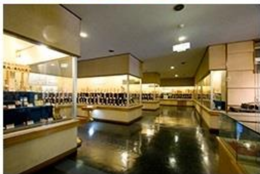
職人が集う「秋保工芸の里」