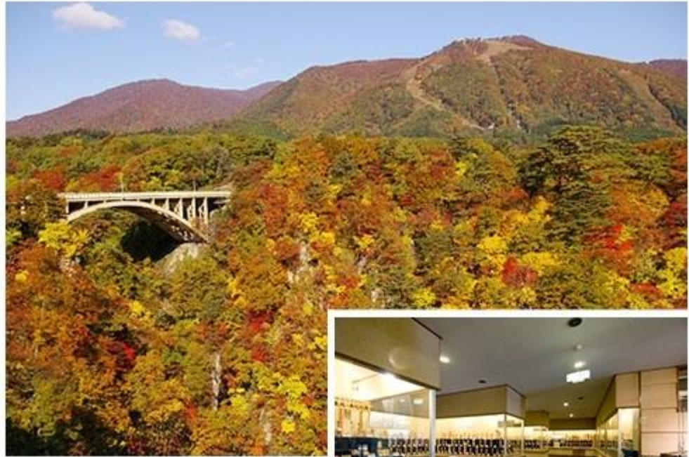
秋には美しい紅葉の 風景が望める鳴子峡