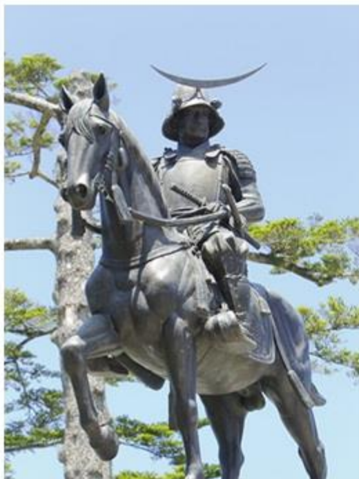
仙台城跡に立つ、伊達政宗公の銅像