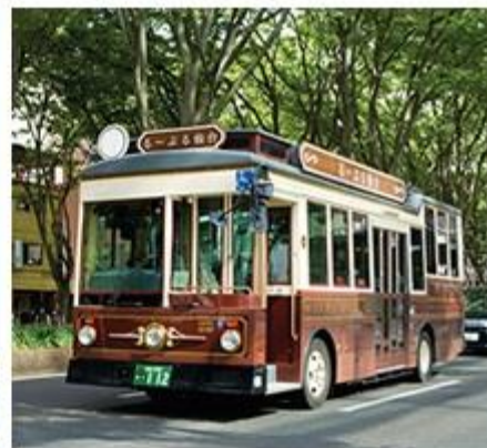
レトロな雰囲気「るーぷる仙台」